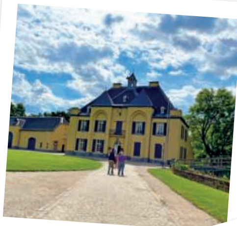
Zeit für die ersten Ausflüge