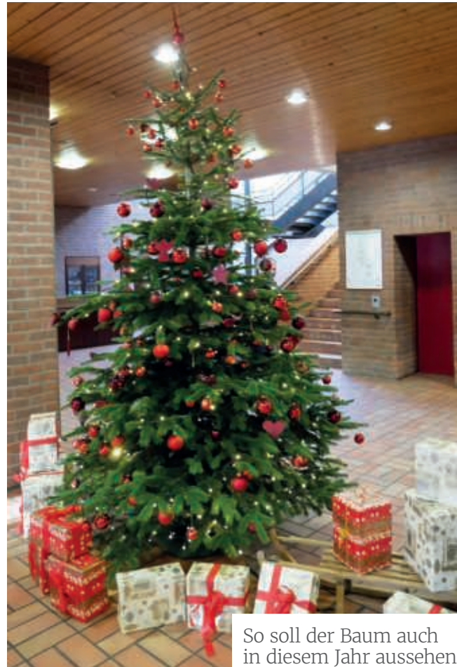
So soll der Baum auch in diesem Jahr aussehen

Aber die großen Bäume kosten natürlich viel Geld. In den letzten Jahren haben Sie mit Ihrer Spende dazu beigetragen, dass wir überall dicht und schön gewachsene Bäume aufstellen konnten. Wir würden uns sehr freuen, wenn Sie uns auch in diesem Jahr unterstützen. Wenn Sie mit einer kleinen Spende für große Bäume sorgen wollen, melden Sie sich bitte einfach an der Rezeption, wir freuen uns über jeden Beitrag. Vielen Dank und bleiben Sie gesund!