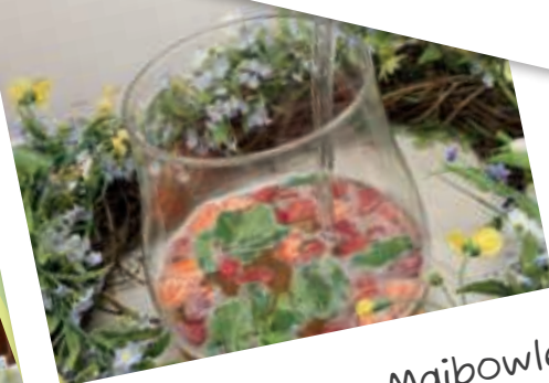
Maibowle gehört dazu