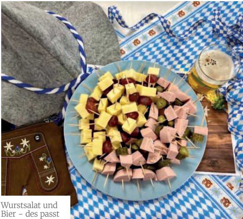
Wurstsalat und Bier – des passt

Es gibt wohl kein Volksfest auf der Welt, das so große Bekanntheit genießt wie das Oktoberfest. Während das Original in München heuer unter Regen und Kälte gelitten hat, haben wir es im Günter-Böhringer-Haus richtig krachen lassen.