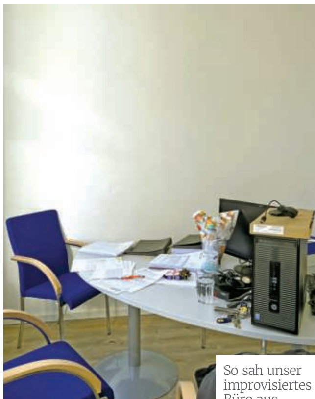
So sah unser improvisiertes Büro aus