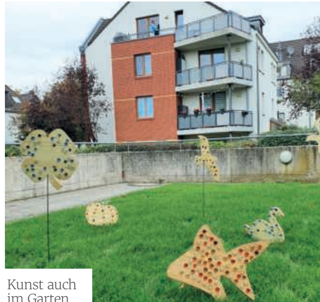
Kunst auch im Garten

Die Besucher der Ausstellung waren Angehörige, Freunde, Bekannte und die Mitarbeitenden des Haus im Park. Auch die Krefelder Zeitungen haben über die kleine Vernissage berichtet. Die Künstler:innen wurden mit Lob überschüttet und waren sichtlich stolz auf ihre Kunstwerke.