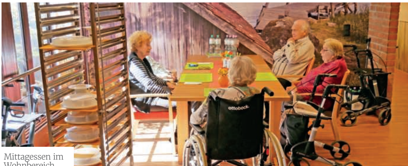
Mittagessen im Wohnbereich

wieder mal schließen, diesmal aber nicht wegen Corona, sondern wegen der defekten Technik! Dabei ist der Speisesaal neben den gemeinsamen Mahlzeiten auch ein wichtiger sozialer Treffpunkt für unsere Bewohnenden.