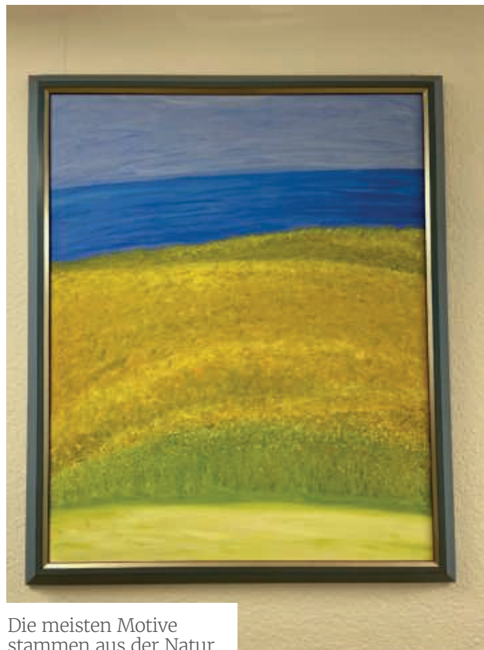
Die meisten Motive stammen aus der Natur