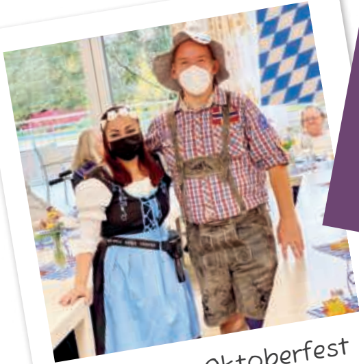
Auch das Oktoberfest wird gefeiert