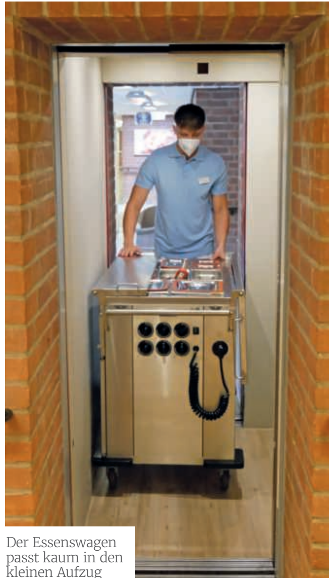
Der Essenswagen passt kaum in den kleinen Aufzug

Natürlich anders als sonst, aber besser als nichts! Und schließlich waren auch diese improvisierten Konzerte immer ein Erfolg.