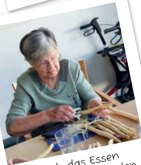
Auch das Essen richtet sich nach den Jahreszeiten