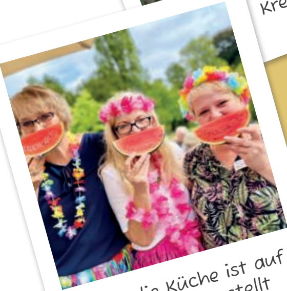
Auch die Küche ist auf Sommer eingestellt