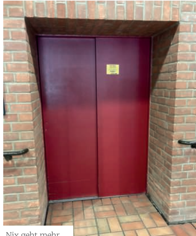
Nix geht mehr

Schuld daran waren die leeren Lager, bedingt durch die Corona Pandemie und Lieferengpässe durch Lockdowns in China. Wir alle kennen die Bilder aus dem Fernsehen, wenn Containerschiffe nicht beladen werden können, weil ein