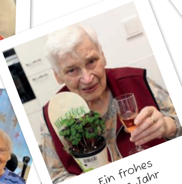
Ein frohes neues Jahr