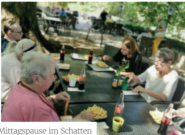
Mittagspause im Schatten

Auch wenn wir dieses Mal nicht so viele Tiere zu Gesicht bekommen haben, war es doch ein sehr gelungener Ausflug. Und wir werden schon bald wieder in den Zoo fahren, um den Rest der 1.000 Tiere auch noch zu entdecken.