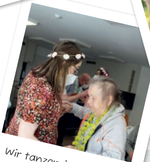
Wir tanzen in den Mai