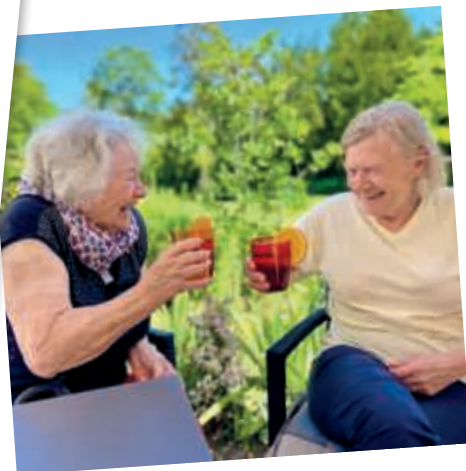
Im Sommer locken kühle Getränke