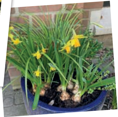
Die Dekoration wird frühlingshaft