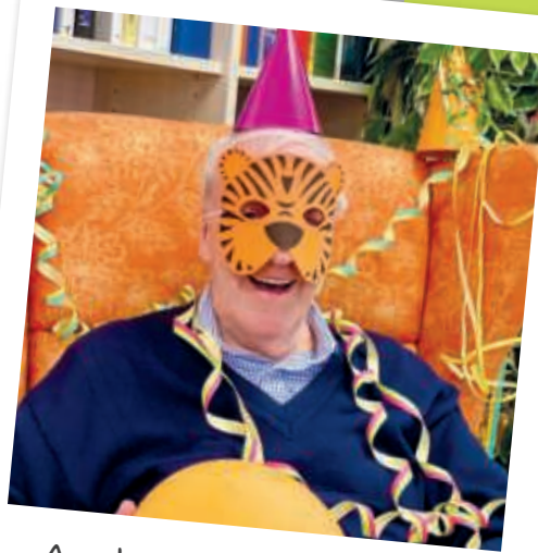
Auch Karneval gehört zum Jahresablauf