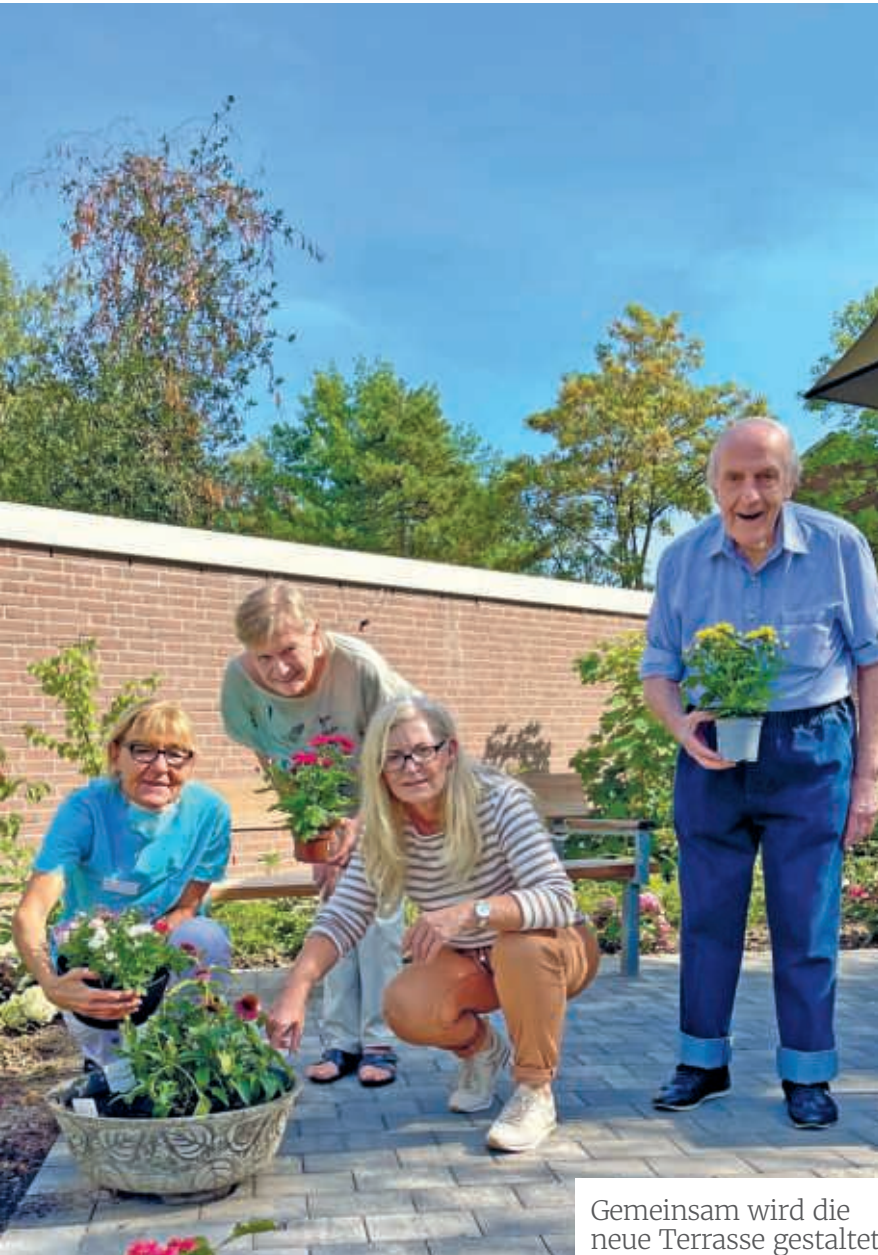
Gemeinsam wird die neue Terrasse gestaltet