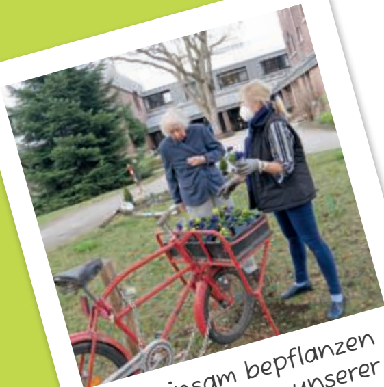
Gemeinsam bepflanzen wir die Gärten unserer Häuser