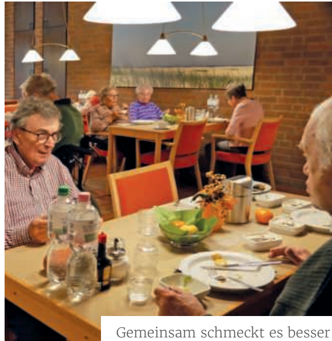
Gemeinsam schmeckt es besser

Trotz der Schwierigkeiten hatte diese Situation auch einen positiven Aspekt: Alle Mitarbeitenden haben sich in diesen drei sehr herausfordernden Monaten gemeinsam der gewaltigen Aufgabe gestellt. Danke für diesen enormen Einsatz, der in der Tat viel Kraft und Ausdauer gekostet hat. Aber gleichzeitig haben wir festgestellt, dass wir Berge versetzen können, wenn wir Hand in Hand arbeiten.