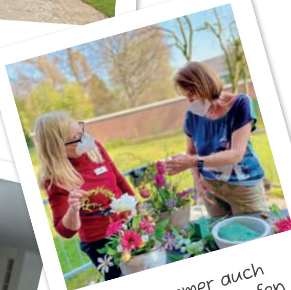
Frühsommer auch in den Blumentöpfen