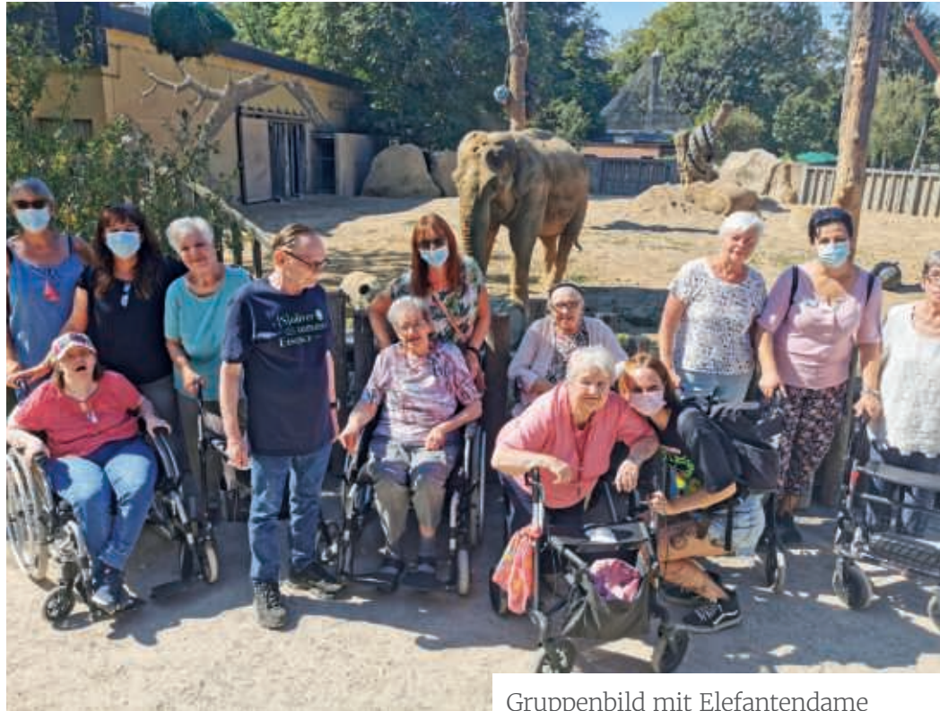
Gruppenbild mit Elefantendame

Bei strahlendem Sonnenschein – für manche war es schon fast zu warm – trafen wir im Zoo sofort auf die Trampeltiere und Ziegen. Auch einige Paviane tobten über die Anlage. Munteren Schrittes erkundeten wir weiter den Zoo. Bei einigen Damen machte sich Enttäuschung breit, waren sie es doch von früheren