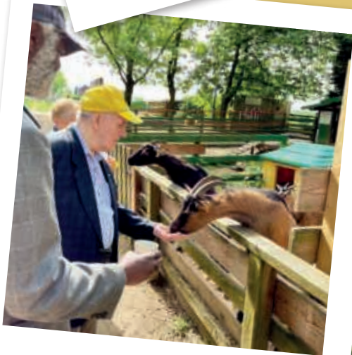
Ausflug in den Streichelzoo