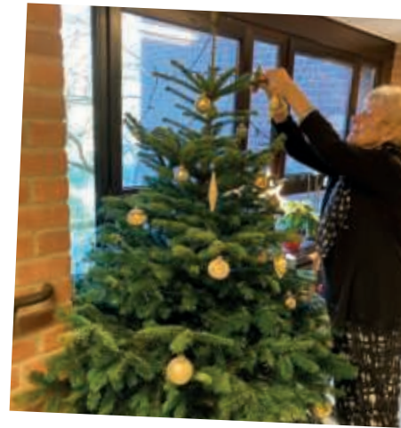
Der Baum wird geschmückt