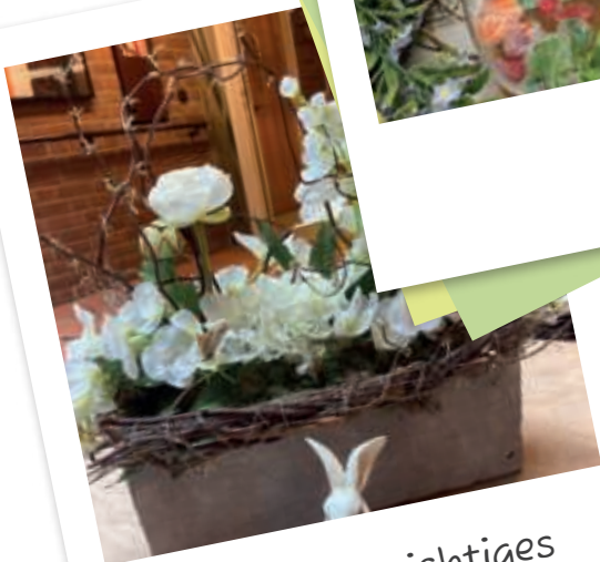
Ostern als wichtiges christliches Fest