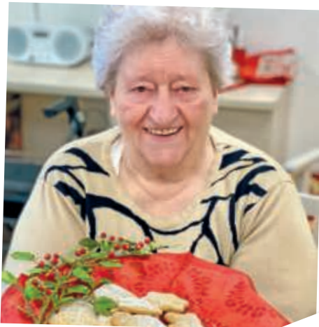
In der Weihnachtsbäckerei