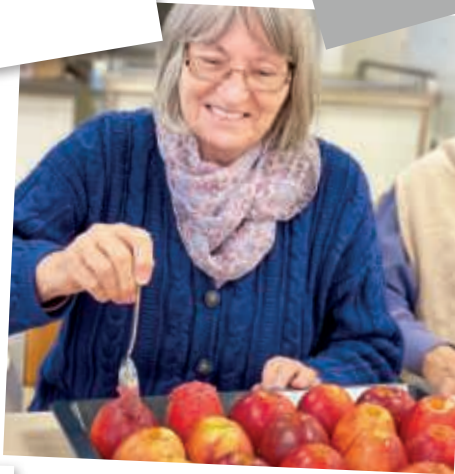
Bratäpfel in der Vorweihnachtszeit