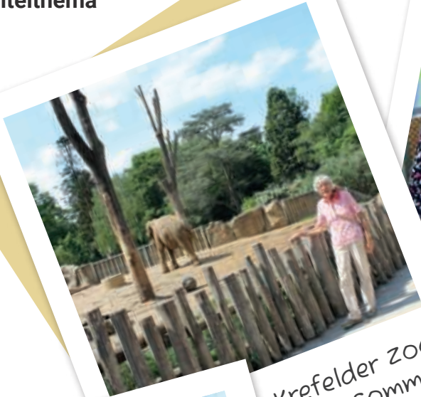
Krefelder zoo im Sommer